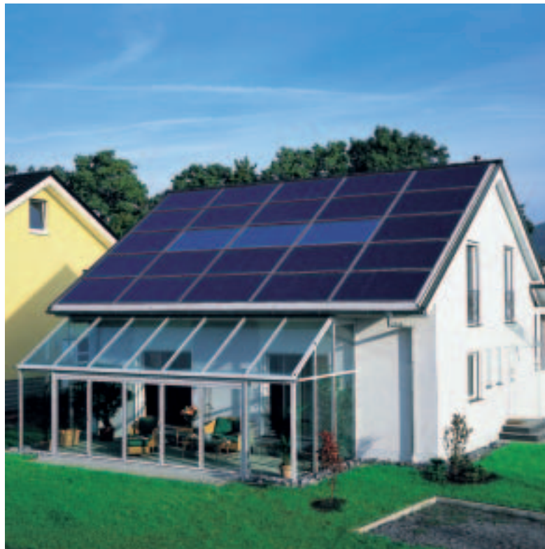
Schüco Ganzdach mit Premium-Modulen und -Kollektoren