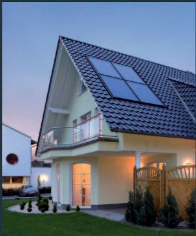
Besonders elegante Indachmontage